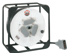
FR-5A (5.5mm 2 )